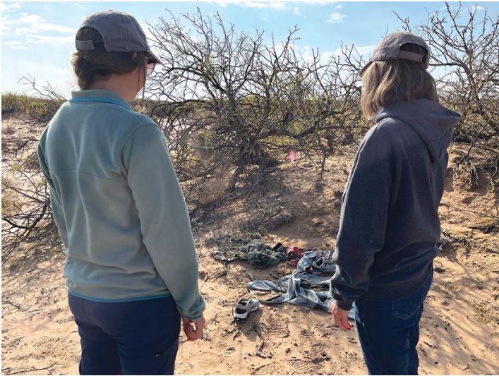
Miembros del grupo de Búsqueda y Rescate Fronterizos dan testimonio de las vidas de migrantes que han muerto en el desierto mientras buscaban una vida mejor.