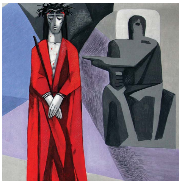
Vía Crucis de la Iglesia de la Santísima Trinidad en Gemunden am Main, Bavaria, Germany.

Te adoramos, oh Cristo, y te alabamos. Porque por tu santa cruz has redimido al mundo.